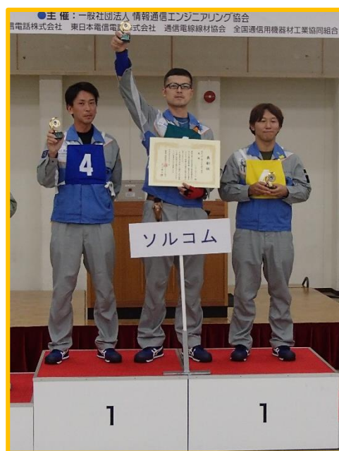
光ユーザ・光アクセス施工部門表彰