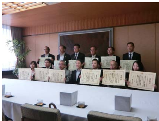
平井県知事と受賞した12団体